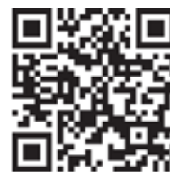
À bwa page web