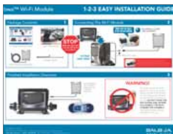
1-2-3 Guide pour une installation facile