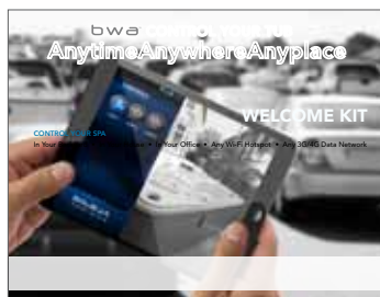
bwa™ - Kit de bienvenue