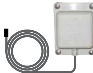
bwa™ Module Wi-Fi (50350)