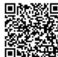
BWA de vidéos sur YouTube