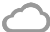
1 An de Cloud Accès à distance *